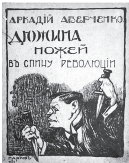
Обложка парижского издания «Дюжины ножей в спину революции» (1921). Худ. Михаил Линский.